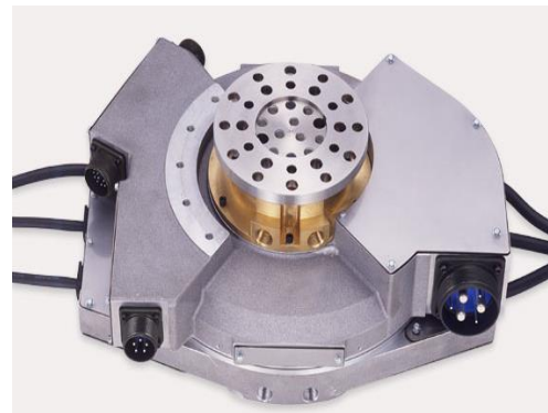
ジャイロジョイント