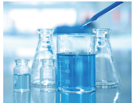
▲ 薬品が付着する対象物