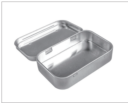
▲ 高温使用の金属コンテナ